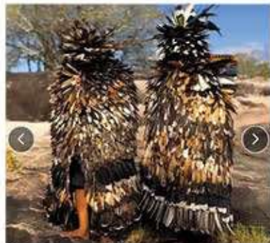
Manto tupynambá juje'y