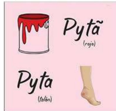
PYTÁ: vermelho PYTÁ calcannhar