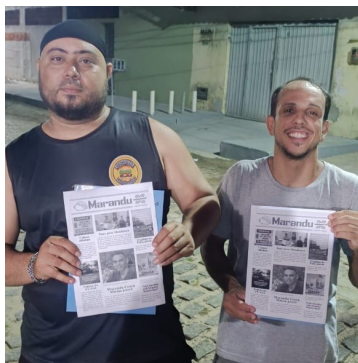
Sombra Guarahyã Drarugh ndi.