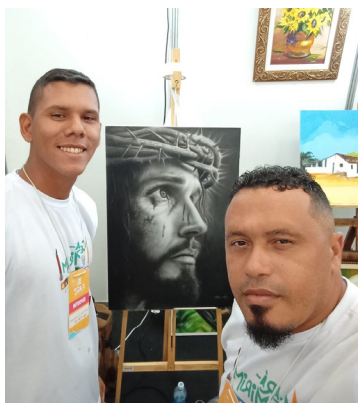
Tapuios Ceara Mirimpegua

Se espalhando pela ZN, o Marandu Impresso, depois de aportar na barbearia do Kun Fu, levado por Drarugh, chega ko'anga Assombrabarpe nesta semana. A ta'anga registra o flagrante.