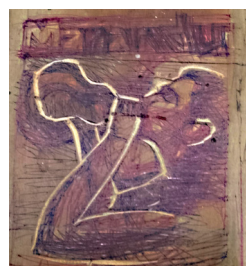
Próximo jopói em curso

Depois dos 40 azougues de porta de geladeira, a Marandu jopoi manhangába, prepara mais um mimo pros seus leitores catupyry: Um azougue com a imagem de um inúbiahára. Teiare!Aguardem.