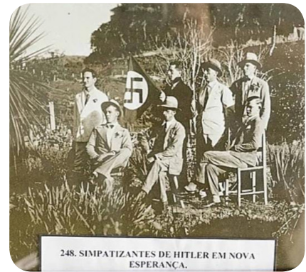
248. SIMPATIZANTES DE HITLER EM NOVA ESPERANÇA.

dar terras pr'esses galegos, . O "O" do borogodó foi que quando surgiu o nazismo: O primeiro partido nazista fora da Alemanha foi criado em Santa Catarina, na cidade de Timbó. Esse foi o maior partido nazista fora da Alemanha no mundo. https://noticias.uol.com.br/politica/ultimas-noticias/2022/02/08/historia-partido-nazista-no-brasil.htm